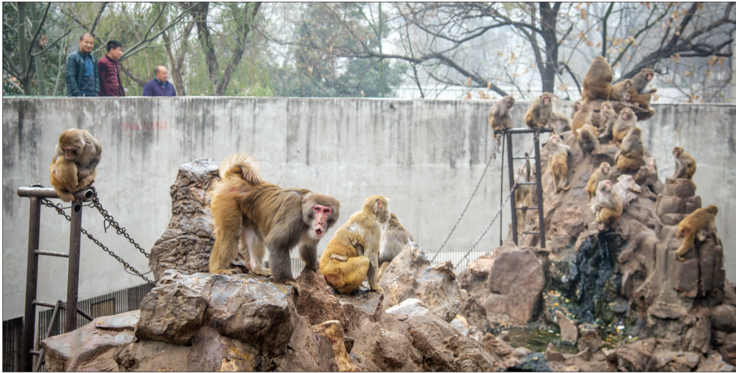
11月至12月猴山纷争不断，这次争宠大战过后，猴山又恢复了平静

“妙龄女郎”因太受宠被猴王的其他“妃嫔”打成重伤，目前已得到救治，不过它恐怕很难回归猴山了