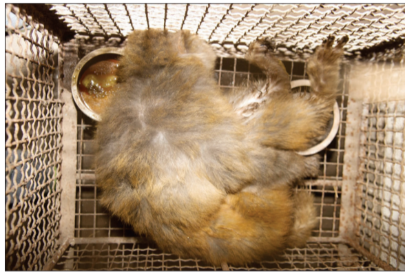
在这次“宫斗”中受伤的猴子，被麻醉治疗后在熟睡

对于记者的这一问题，刘兆阳摇摇头说：“猴子是群居动物，有很强的族群观念，按照它们的习性，受伤的猴子离开猴山后，如果再回去，一定会被众猴群起而攻之，直至打死，所以它恐怕很难再回归猴山了。虽然很无奈，但猴子的生存