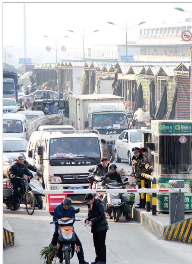
洛阳宏进农批人、车川流不息

由此,洛阳宏进农批农副产品的供销链进一步被打通,随着与多家餐饮企业实现对接,其销售环节的链条“结构”和“质地”,也将发生重大变化——更牢不可摧,抗风险能力也更强。