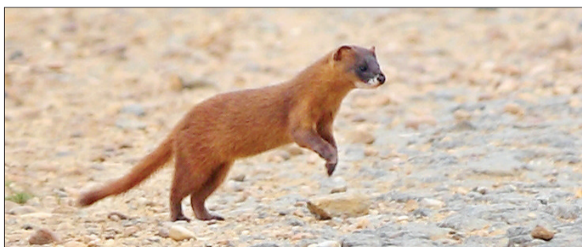
纵身一跃(拍摄于汝阳)