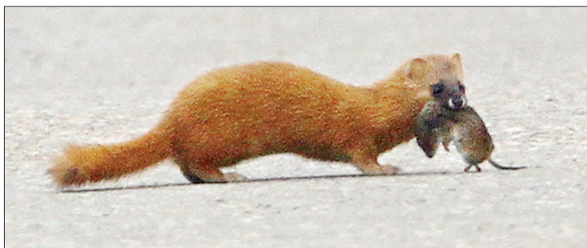
叼着老鼠的黄鼠狼快速通过马路(拍摄于嵩县)