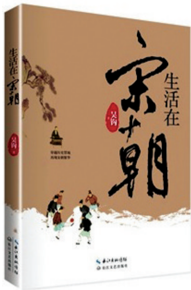
穿越宋朝 感受繁华