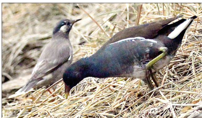
灰椋鸟(左)和黑水鸡