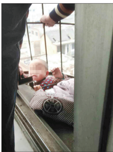
孩子仅头部卡在防盗网间隙里