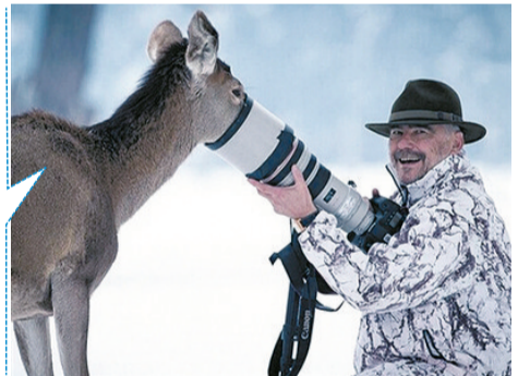
给点儿吃的,不然不让照