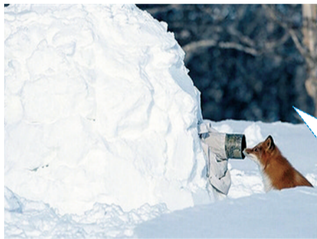
不许动,你被发现了