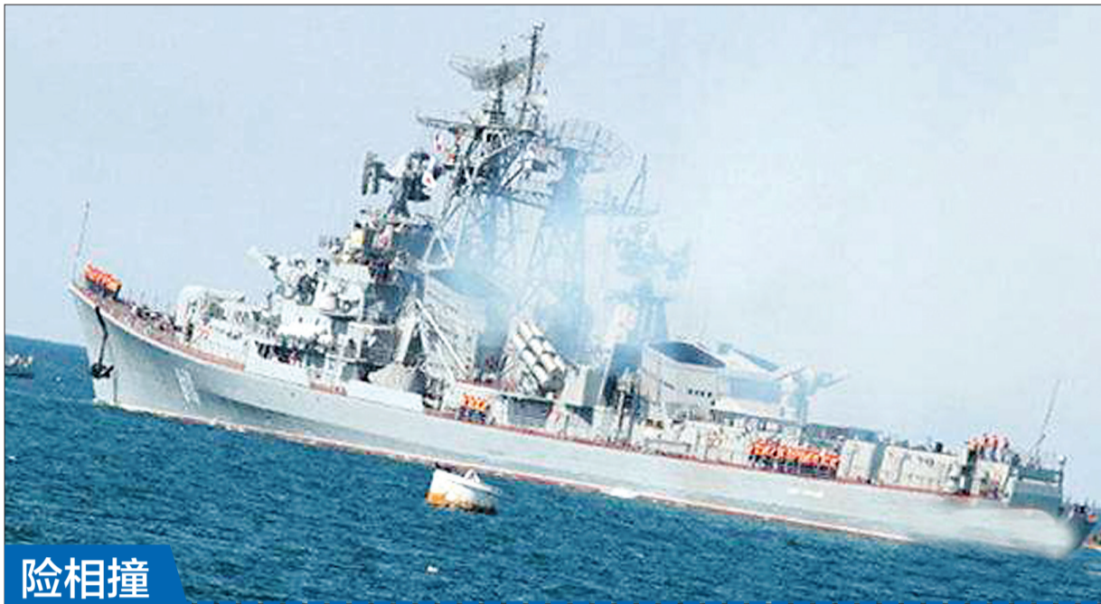
俄罗斯“敏捷”号导弹驱逐舰