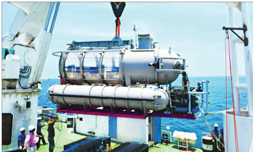
“寰岛蛟龙1”号 (资料图片)