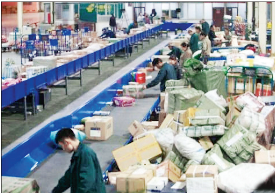
“双十一”全民网购狂欢节过后,快递迎来高峰

《快递条例(征求意见稿)》自11月16日起正式向社会征求意见,12月15日是征求意见的截止日。自征求意见以来,新规对快递员抛扔、踩踏快递包裹,快递运单信息填写不完整,冒领、私拆、倒卖他人物件等行为的高额处罚备受舆论关注。