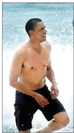
奥巴马在夏威夷游泳