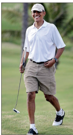
奥巴马在夏威夷打高尔夫球