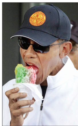
奥巴马在夏威夷街头吃刨冰