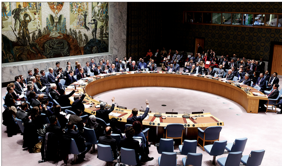
十二月十七日，联合国安理会在纽约联合国总部举行会议。