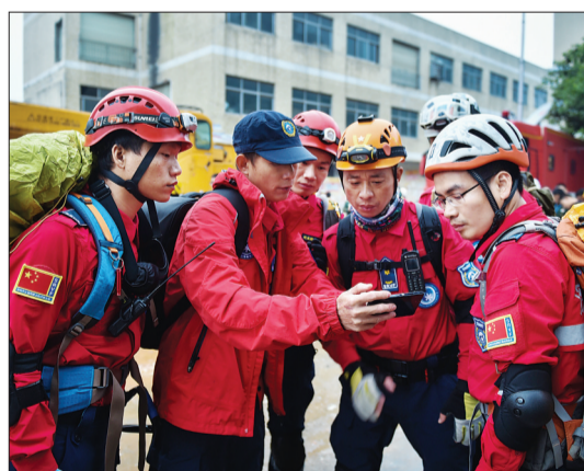
救援人员在商议救援方案

深圳市和光明新区已启动救援应急预案,成立现场救援指挥部和现场搜救组、现场监测组、医疗保障组等10个小组,并组织公安消防、公安特警、卫生、应急、安监、办事处、住建等部门近1500人开展搜救