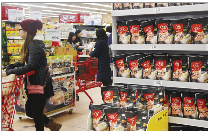
十二月二十日,在韩国首尔一家大型超市,人们选购参鸡汤等韩国产品

机遇不仅存在于货物贸易方面。中韩自贸协定承诺未来采用准入前国民待遇和负面清单模式开展服务贸易和投资谈判,设立电子商务章节;中澳自贸协定在服务和投资领域也有较大收获,中医“走出去”及深化多层次人文交流是亮点。