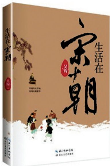
穿越宋朝 感受繁华

宋朝文化是中国古代文化的顶峰，宋朝也是中国科学发展的鼎盛期，那个时代如果有诺贝尔奖，中国人获奖必如探囊取物。