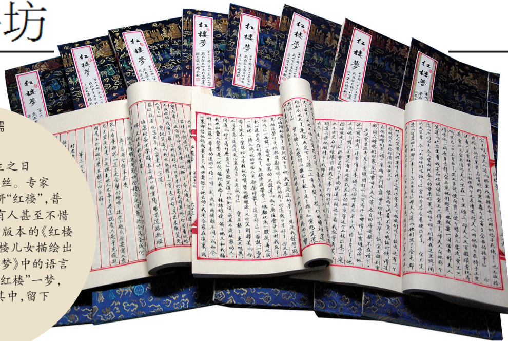
手抄版《红楼梦》

《红楼梦》自诞生之日起,就不缺铁杆儿粉丝。专家学者“深入”大观园钻研“红楼”,普通百姓也常津津乐道,有人甚至不惜重金收藏晚清至今各种版本的《红楼梦》,有人费尽心血把红楼儿女描绘出来,也有痴人模仿《红楼梦》中的语言风格,自创“红楼体”。“红楼”一梦,无数痴情男女沉醉其中,留下了许多故事。