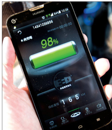
手机可对eQ进行远程操作

结语:eQ的厂家指导价为15.99万元至16.49万元,但结合国家、地方对新能源汽车的补贴,实际购车价在7万元以内。单次充电续航里程200公里,说长不长,说短不短,对于城市、乡镇居民而言,eQ这样的小车用来代步再合适不过了。只是比汽油版车型贵出的差价到底值不值,这笔账还得消费者自己好好算算。