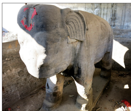
被“圈养”保护的石象