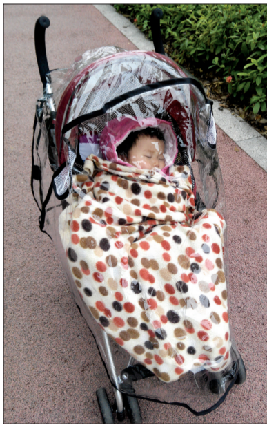
妈妈要去接老大了,老二还在呼呼大睡