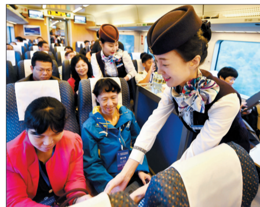
12月30日,海南环岛高铁的列车员为游客发送饮用水和水果

从12月30日起,只需要花3个小时,“坐着高铁游海南”成为现实。30日9时40分,海南环岛高铁西段首趟列车准点发车,它将和2010年12月开通运营的海南环岛高铁东段连通,成为全球第一条热带地区的环岛高铁。