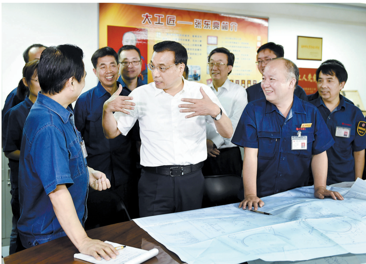
2015年9月23日,李克强总理在中信重工同工人亲切交谈