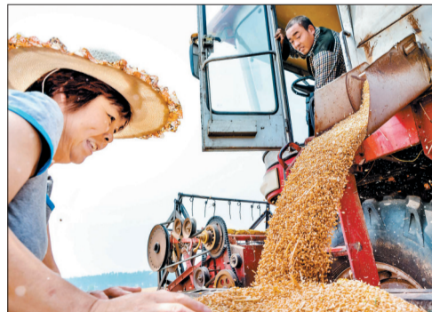
洛阳小麦连获大丰收