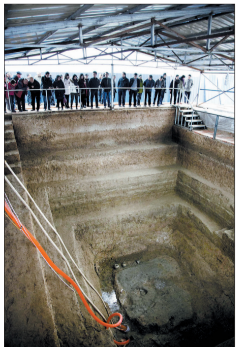
陆浑戎考古发掘现场