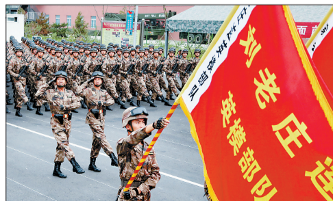
赴京参加胜利日大阅兵的铁军官兵