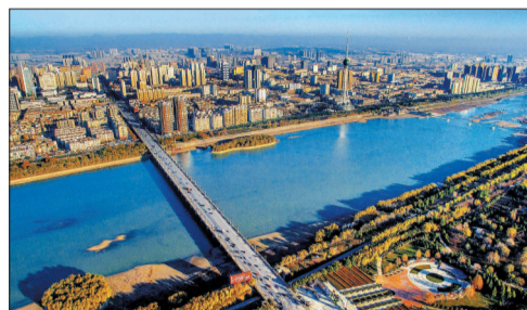
洛阳水生态文明建设全面推进

2015年12月16日,洛阳市年度接待游客量首次突破1亿人次,实现了历史性突破。其中,第33届中国洛阳牡丹文化节接待游客量逾2174万人次,2015洛阳河洛文化旅游节接待游客量首次突破1000万人次,隋唐百戏、天下洛阳等演艺项目广受好评。作为全省唯一的全国旅游标准化和智慧旅游双试点城市,洛阳将加速建设国内一流、世界知名的旅游目的地和旅游集散地。