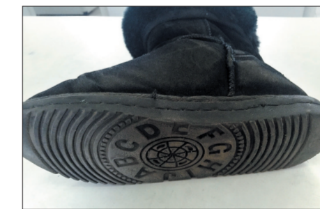
● 3号:雪地靴(鞋底较软,纹路较少)