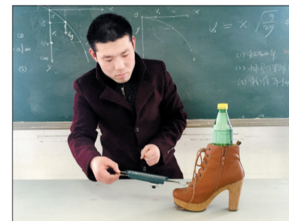
匀速拉动,认真测量