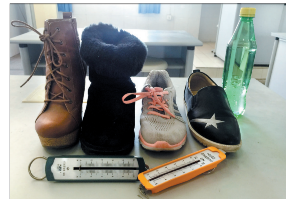
四种鞋,哪种最防滑呢?

在洛阳理工学院附中和洛阳师范学院的技术支持下,《洛阳晚报》记者做了一组有关鞋底摩擦力的实验。来看看您的鞋是否保险吧?