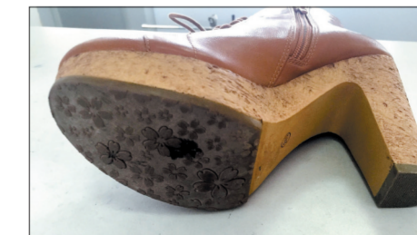
● 4号:高跟棉鞋(鞋底材质较硬)