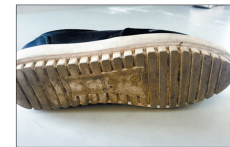
● 1号:女士单鞋(鞋底材质较硬,纹路较深且较密集)