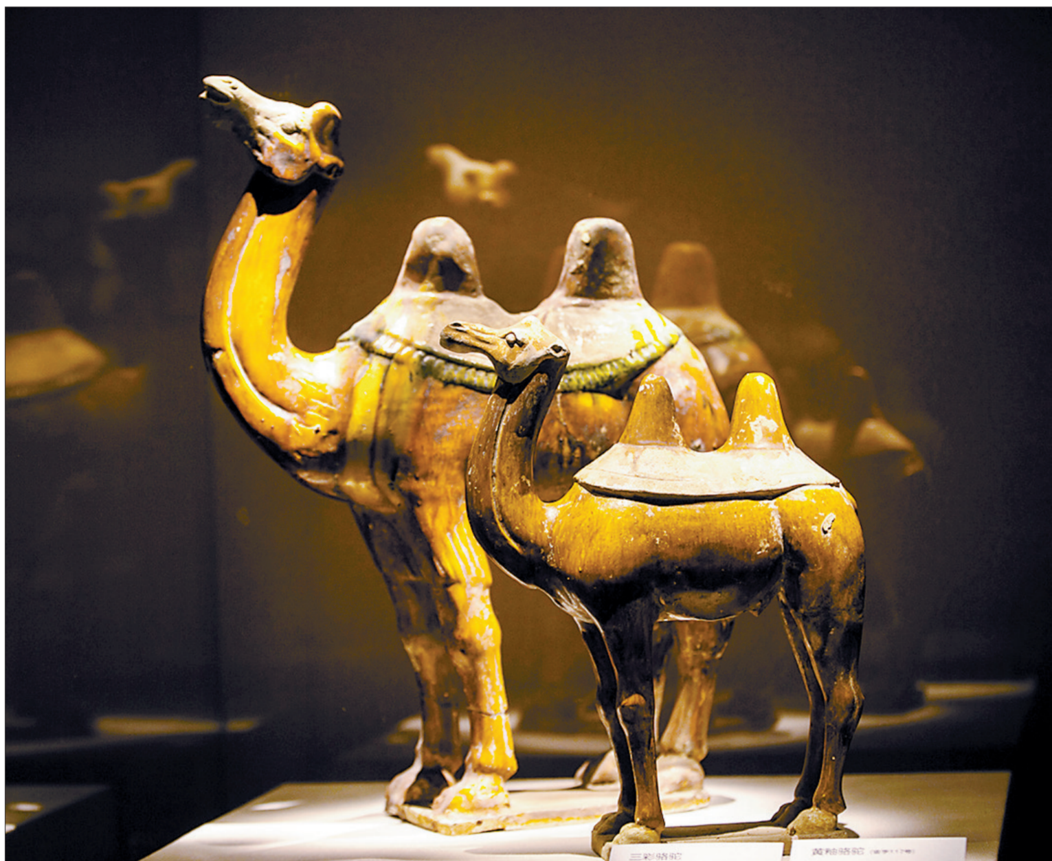
一大一小两只骆驼分别来自大陆和台湾