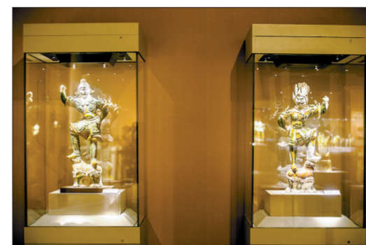
两件天王俑威风八面