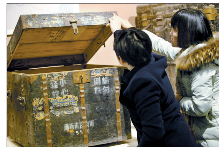
用来装文物的木箱子