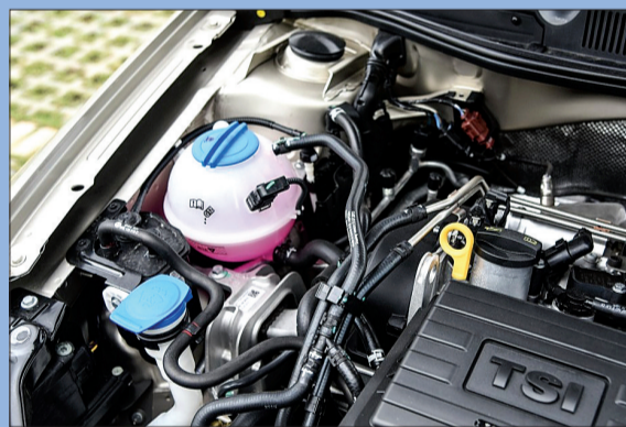
红色液体为防冻液