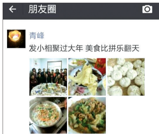
林先生朋友圈截图