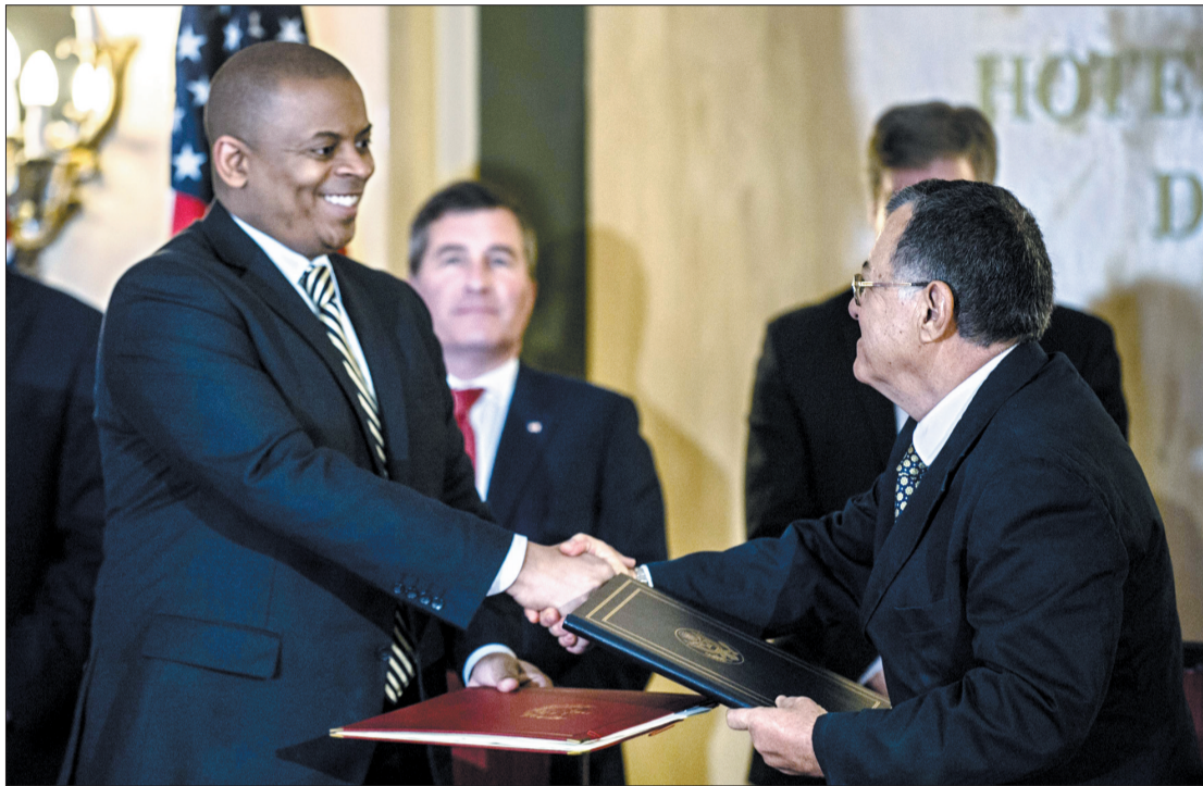
2月16日,在古巴首都哈瓦那,古巴运输部部长阿德尔·伊斯杰尔多·罗德里格斯(前右)和美国运输部部长安东尼·福克斯(前左)在签署协议后握手