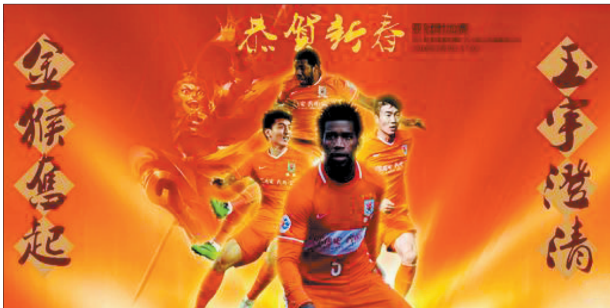
山东鲁能亚冠海报