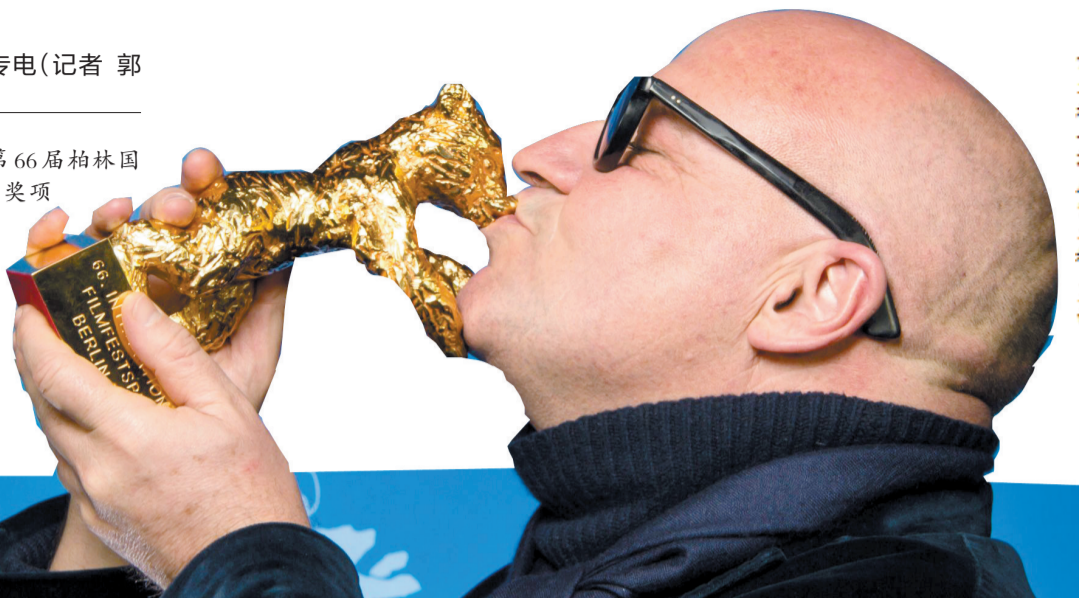
意大利导演詹弗兰科·罗西

北京时间21日凌晨,第66届柏林国际电影节主竞赛单元各大奖项揭晓,中国台湾资深摄影师李屏宾凭借在《长江图》中极具诗意的电影画面荣获杰出艺术贡献银熊奖(摄影),意大利难民题材纪录片《兰佩杜萨纪事》获得最佳影片金熊奖。