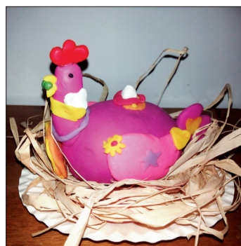
《快乐的鸡》 作者：刘佳辰 中信小学四（3）班