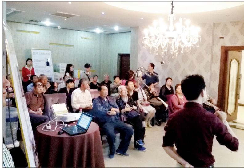
往期装修讲座现场

届时,设计师将带您深入体验标准化样板间,零距离参观、学习样板间间的设计与工艺。设计师及工程人员还将跟随参观团进行讲解,让您在专业人员的讲解中,解决装修难题。