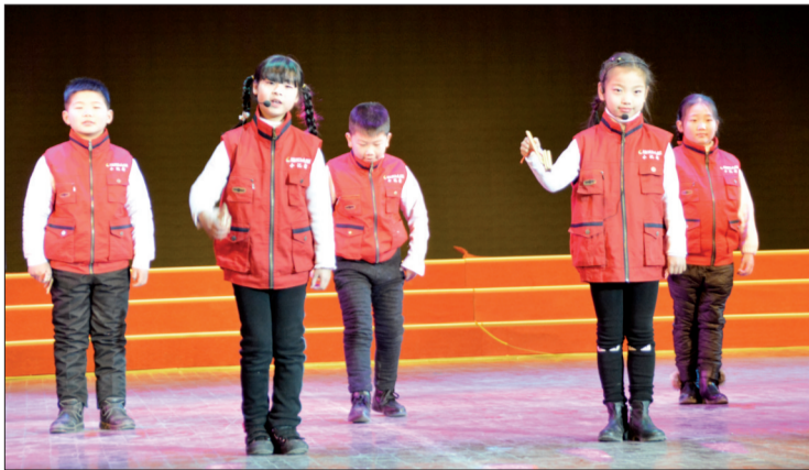
学员在小记者猴年春晚表演快板

小记者口才与主持班春季班聘请广电资深主持人、业内资深指导老师任教,针对脱口秀、话剧、快板儿、小品等专业性较强的节目进行编排,打破传统教学模式,在演出实践中学习,全面增强孩子的舞台掌控能力和现场表演能力。