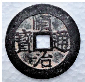
顺治通宝