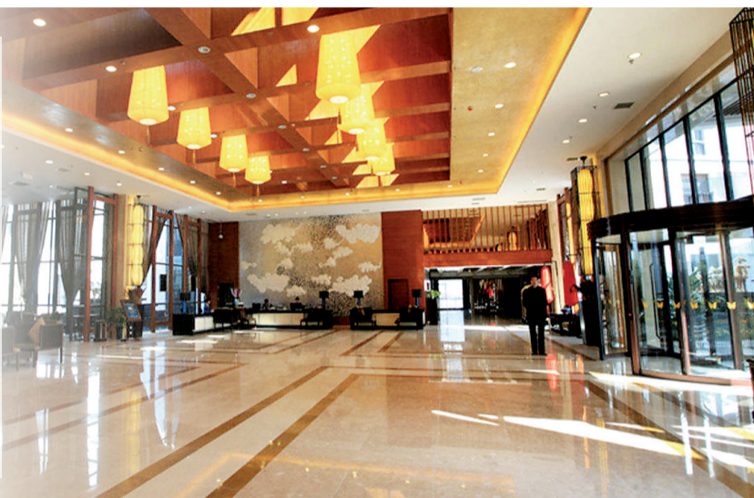
高贵、典雅的酒店大堂 (资料图片)

在栾川,有一家按照五星级标准建造的园林式酒店——伊水湾大酒店,近两年来在行业内的知名度不断攀升。这家建在县城里的大酒店,如何从全市诸多旅游企业中脱颖而出,作为优秀旅游企业代表的呢?记者在采访后,得以解惑。