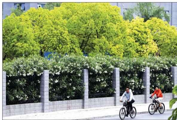
滨河北路白色的夹竹桃花盛开