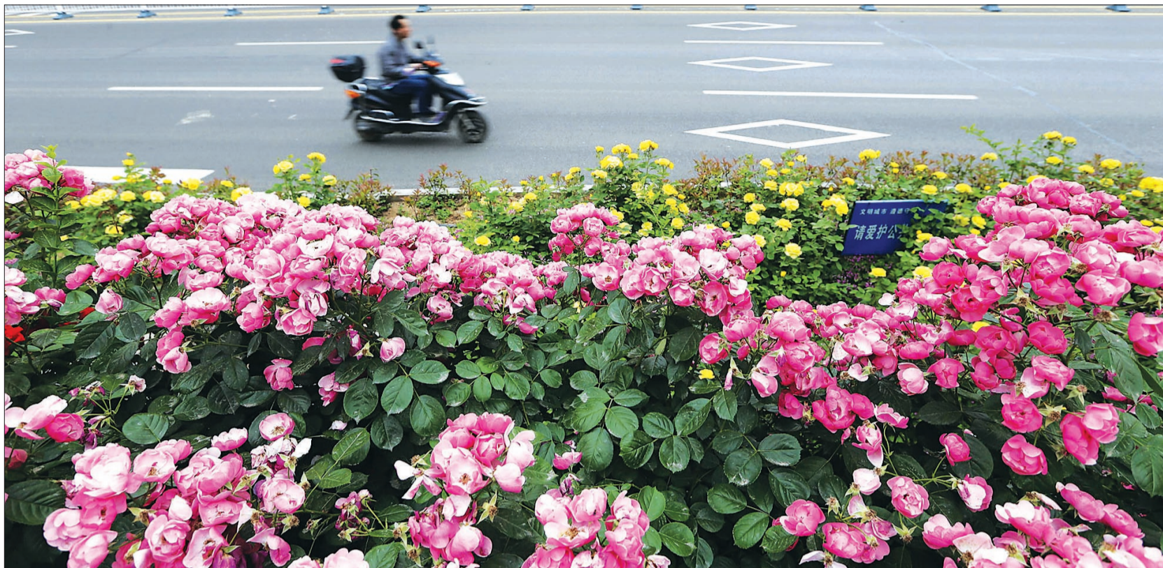
九都路的月季花开得正好