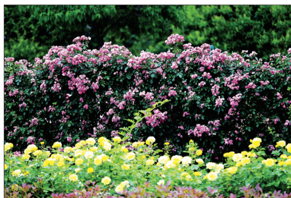
九都路的月季盛开