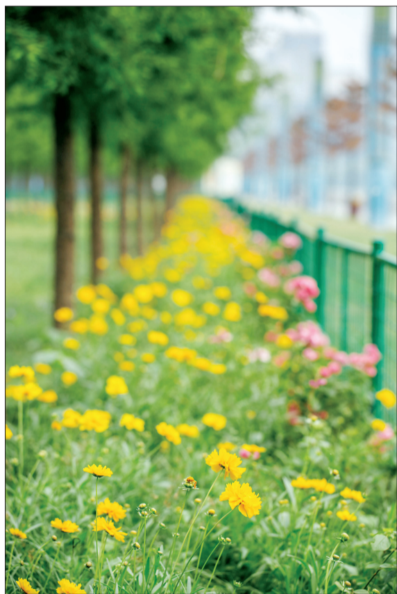
开元湖音乐喷泉旁的小花