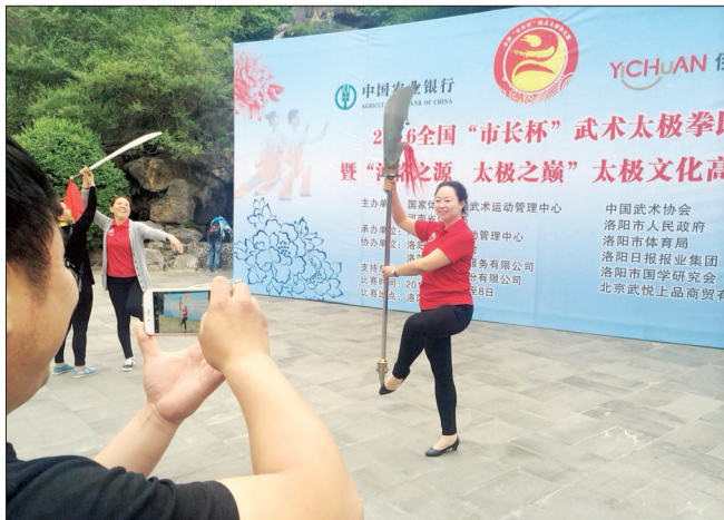
一看就是“练家子” 摆出姿势留影纪念