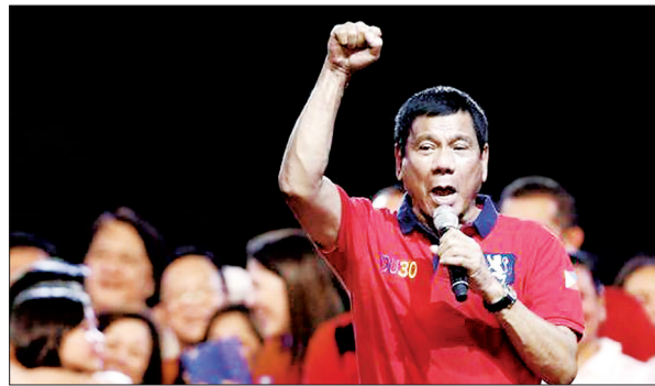
杜特尔特 (网络图片)

美国与菲律宾近年来关系愈发密切，美国军事力量重返菲律宾。杜特尔特上台后，在美国的军事、政治影响下，菲律宾的对华态度能发生多少改变，尚不得而知。总之，菲律宾的外交政策，不能以竞选说辞为准，还需要看杜特尔特执政以后的表现。