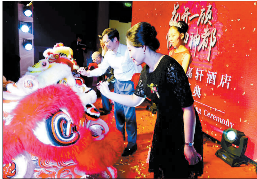
酒店开业典礼