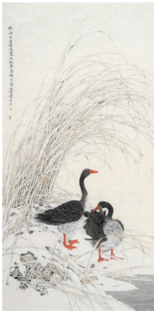
《卧向白云情未尽》69×137 作者:郭晓慧

专家点评:该作品的作者在构图上下了很大的功夫,有千变万化的效果。结构分割到位,用笔灵动,对树的刻画很丰富,墨色层次分明,表现出豫西地区的风貌,表现了微风轻拂的意境。