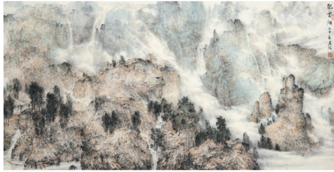
《观云烟》136×69 作者:周清波

专家点评:该作品重点刻画大山之中“清泉石上流”的意境,营造云雾缭绕、虚无缥缈的氛围。画面静中有动、动中有静,给人一种灵动的感觉,笔墨技巧生动、老辣,使观者心情愉悦。