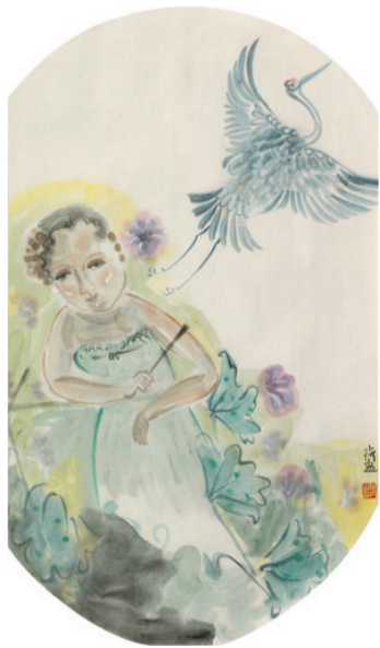
《写意人物》38×68 作者:何淑娟

专家点评:该作品很生活化,画面上有荔枝、石榴、插花,又通过对茶壶和茶杯的刻画,传达出一种轻松愉悦的生活状态。整个画面的构成精彩,诗书画印的结合也很和谐。