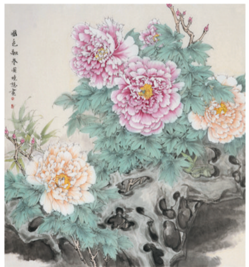
《国色融春图》89×96 作者:郭晓慧

专家点评:该作品通过对冬天景象的准确捕捉,表现了一种意境深远的萧瑟感。对两只天鹅的刻画十分到位,线条力度感很强,充分表现出作者的功力。作品十分雅致。