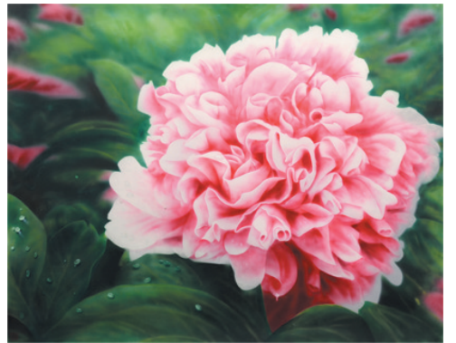
《花王》97×75 水粉画 作者:鲁庆岭 专家点评:该作品是以现代喷绘技巧为主创作的,借用写实主义的技法,利用喷绘的手法使画面具有强烈的现代感,而喷绘技巧又使画面中的虚实更为明显。