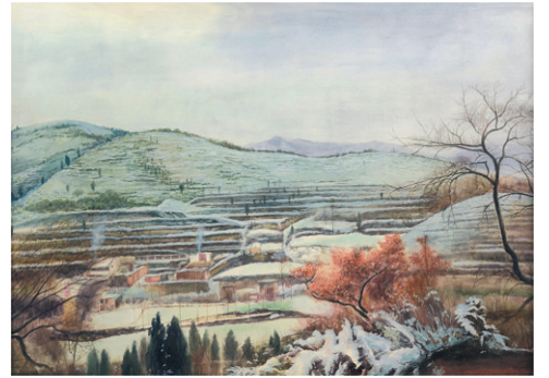
《又见炊烟》105×75 水彩画 作者:刘华东 专家点评:该作品描绘了丘陵地区山村、树林及冬天的场景。画面气势磅礴,对于空间处理悠远、细致,一望便可以感受到乡村特有的气息,引人遐想。