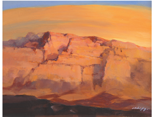
《山·印象》60×49 丙烯画 作者:马智 专家点评:该作品为一幅暖调的风景画,表现了日落时的山景,画面色彩绚烂,处理到位。

专家点评:该作品运用较现代的卡通艺术造型方式,运用大量国际元素,如浮世绘、云纹等,虽融入的手法和元素较多,但最终形成的画面非常统一和谐。在画面的人物布局、背景以及道具的使用上非常讲究,借用了较多东方元素,如假山石、荷花以及传统民间纹饰等,使其融合在一起,形成了一组具有强烈时代感的作品。