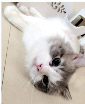
快说,你爱不爱我,快说