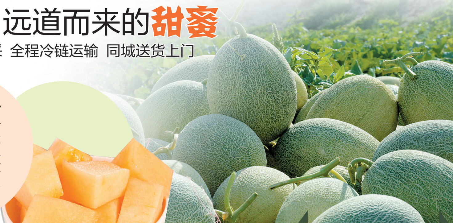
淖毛湖哈密瓜 (资料图片)

盼望已久的淖毛湖哈密瓜终于来了！马上就能吃到脆爽甘甜的晚熟哈密瓜啦。今天，洛报集团购时惠网上商城配送团队已经准备好，开启全城配送模式，请预订过的读者朋友坐等美味上门。