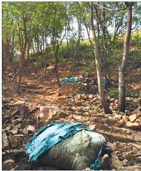
山上被遗弃的水泥,不远处就是长城