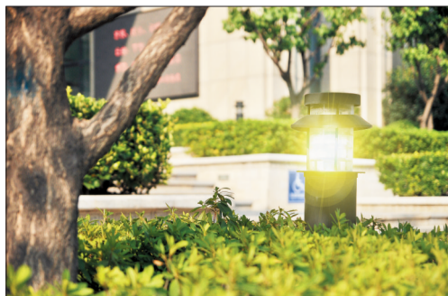
绿树成荫 (本版图片均为资料图片)