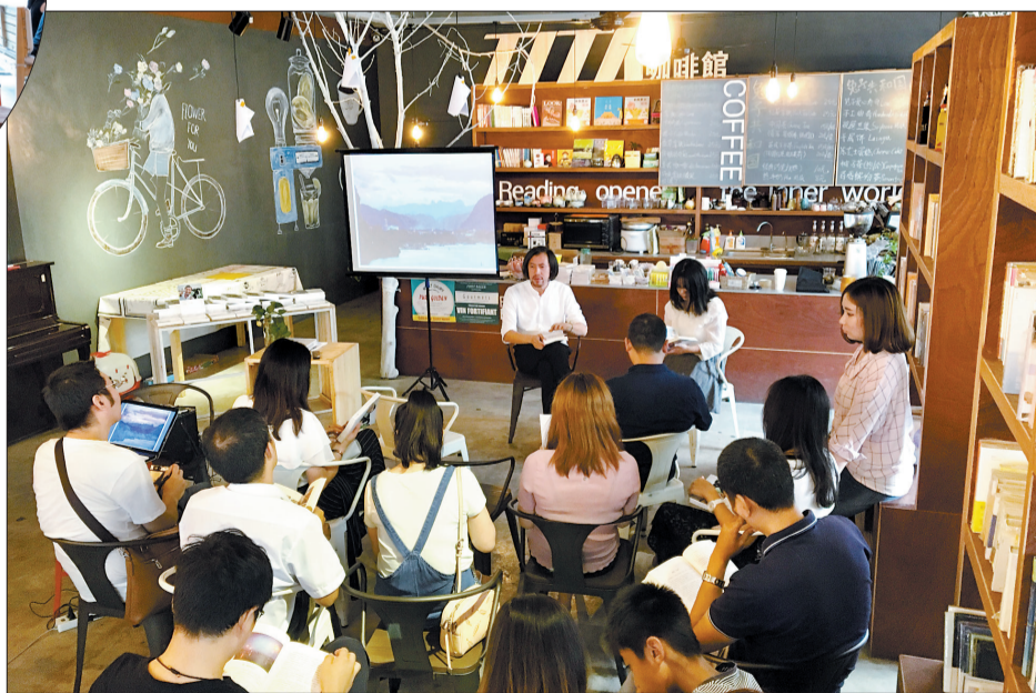
听火火讲故事，仿佛在读一本新书