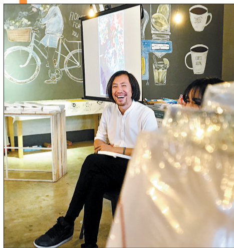
聊着聊着就笑起来