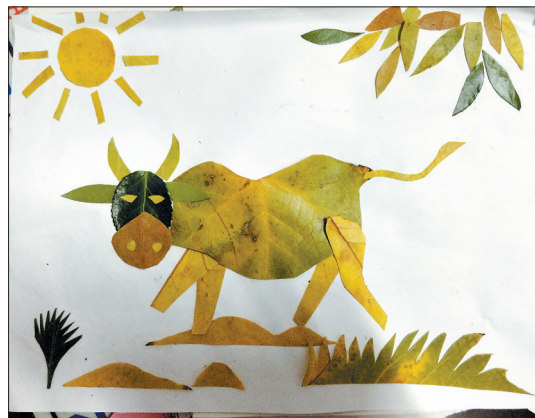
《小牛散步》方怡涵(八岁) 市直九小 指导老师:章瑛