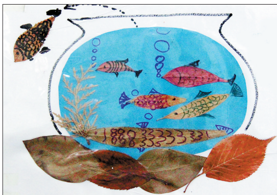
《鱼的一家》柳絮然(六岁) 东升一小 指导教师:马荣