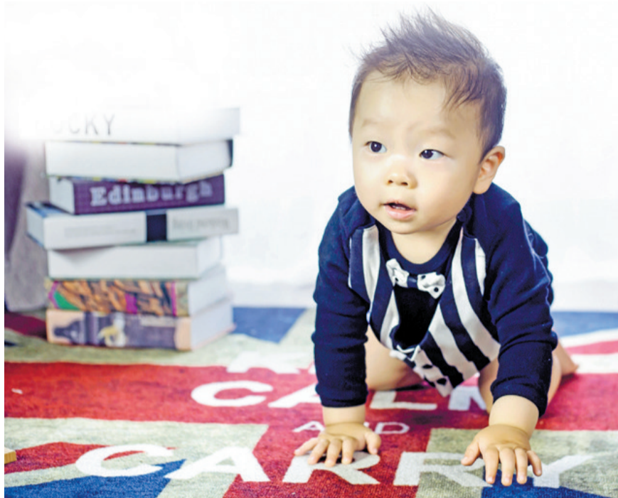
蹦蹦一周周年纪念照

建议上豆瓣读书看看,9分以上的绘本评价较好,可选读。选择绘本时注意甄别作者国籍,一些绘本传递的理念不一定适合中国孩子,有些绘本的知识距离我国国情较远,盲目阅读易引起孩子知识体系混乱。