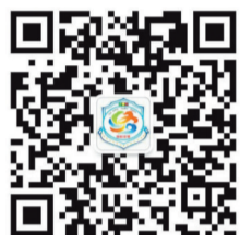
“洛阳交警微发布”微信公众号