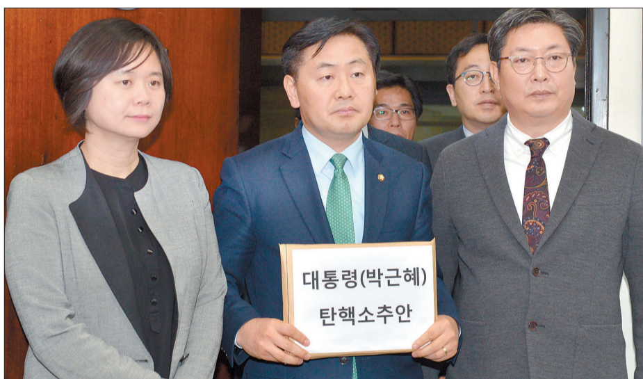
(朴槿惠)弹劾案「字样的文件」