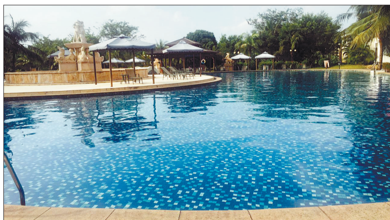
豪华舒适的老榕树温泉度假酒店

酒店不仅提供免费大餐,还有泳池、健身房、棋牌、乒乓球、桌球等免费服务。此外,总价值2640元30天的温泉门票也将一并送给您,让您和家人尽