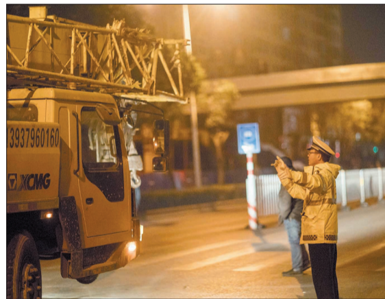
交警指挥吊车驶入起吊区域