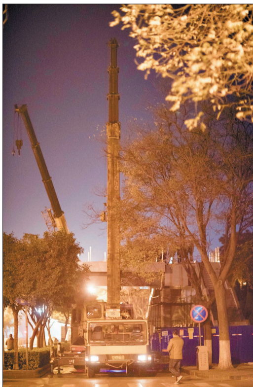
吊车铆足劲儿,准备吊起“大家伙”

随后,施工单位将对这两座天桥的扶手与护栏进行安装,等收尾工程结束后即可投入使用。