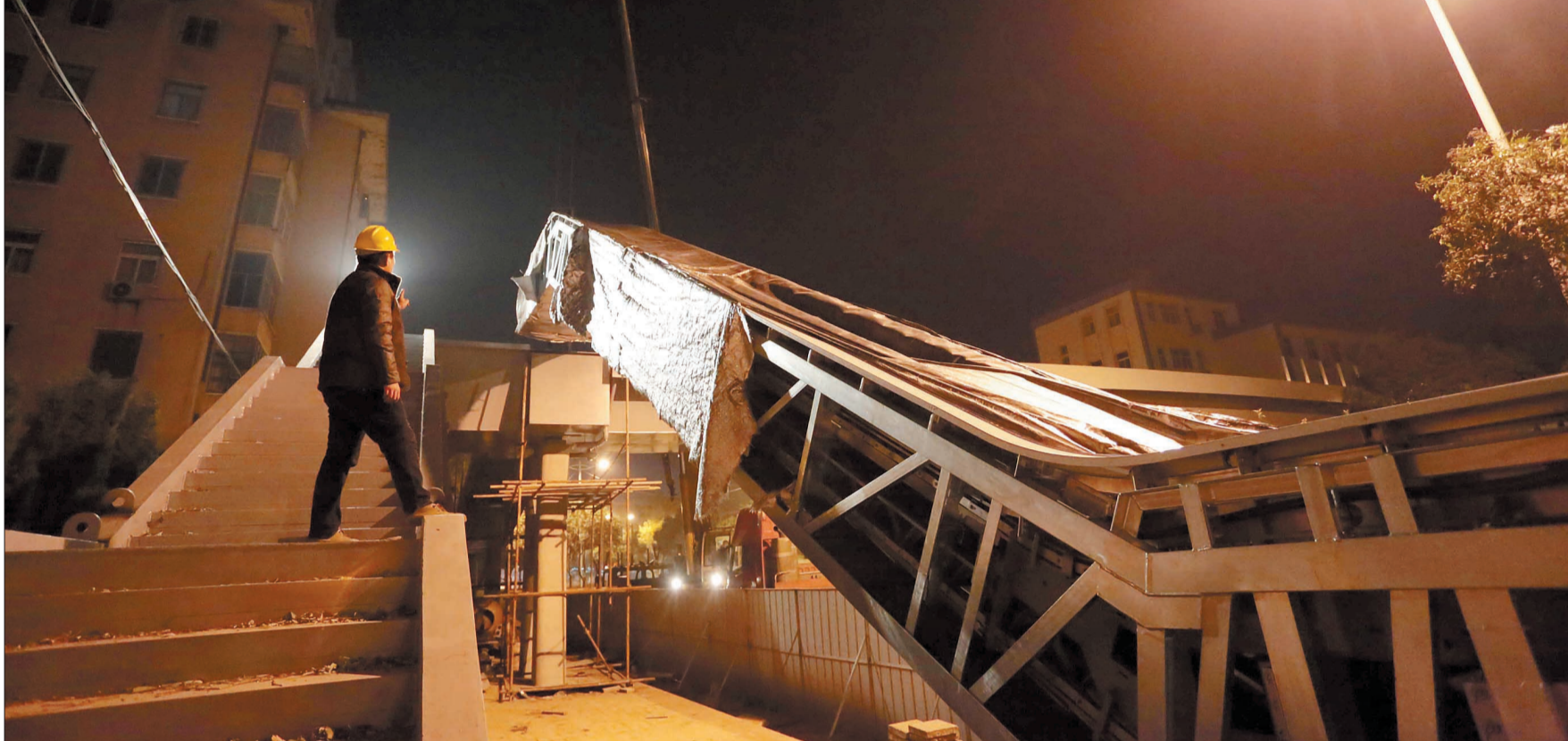
大家齐心协力,扶梯终于成功吊装